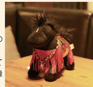
▲「ふわふわほにより。」のマスクットキャラクター・松風店長

ワイヤーの技術もますます磨きたいですし、今までやったことのない活動もやりたいです。これまでに、師匠とのご縁や、宝塚でのご縁、作家活動を通して出会った方々とのたくさんのご縁がありました。皆さんとのご縁を大切に、これからも作家活動を続けていきたいですね。