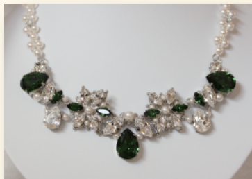
▲「風と共に去りぬ」スカーレット・オハラをモチーフにしたネックレス。

一巻きのワイヤーから作品を作っていくんです。長い一本のワイヤーを切り分けて、束ねたり編み込んだり…太さの違うワイヤーを組み合わせるのも面白いですね。技術的に難しいこともあるんですが、人がやっていないジャンルのワイヤー作品を作りたいと思っています。私がワイヤーをはじめたきっかけの師匠がいらっしゃるんですが、今も師匠にアドバイスをいただきながら、技術を高めようと頑張っています。私は舞台を見るのが好きなので、モチーフは舞台や歴史上の人物を用いることが多いです。